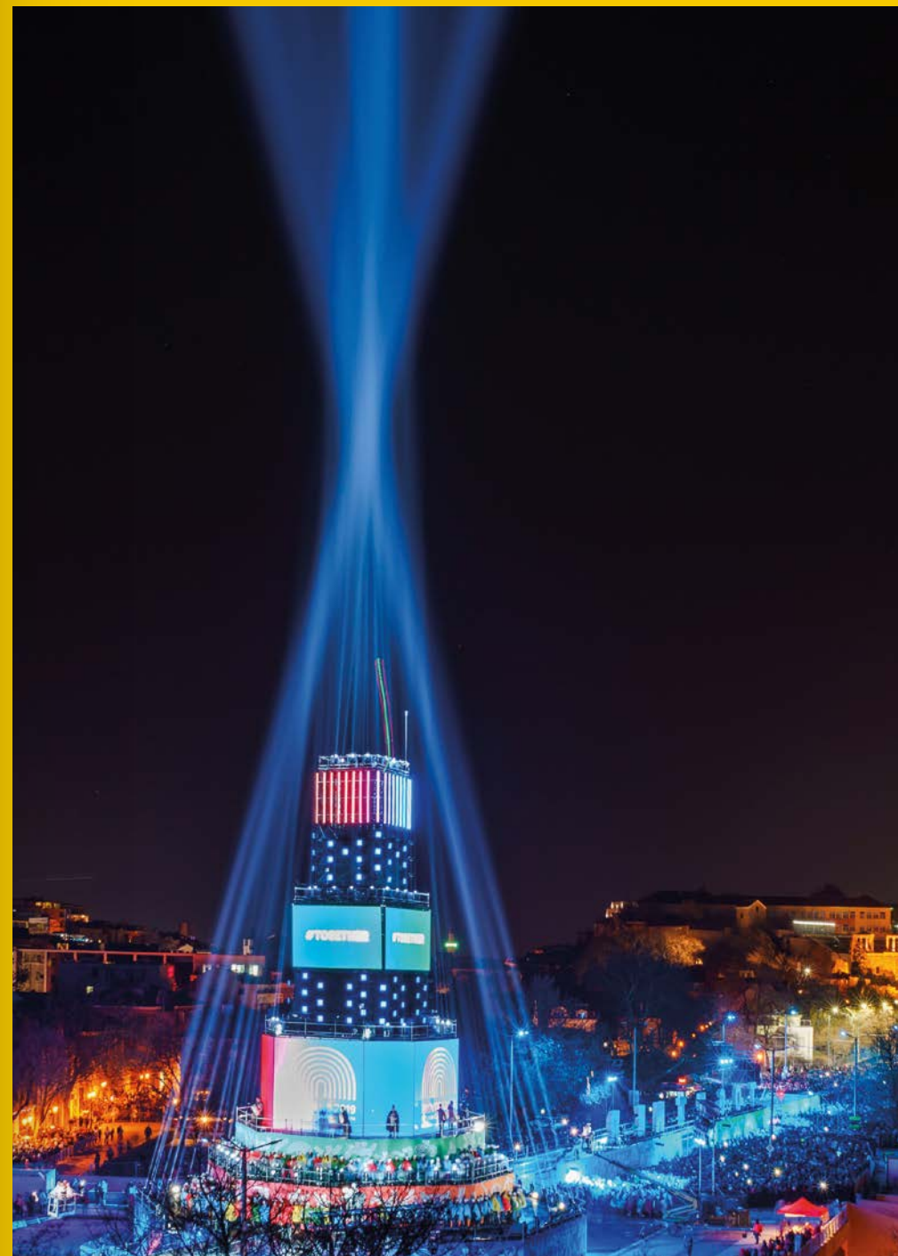
© Иван Мангевски / Ivan Mandevski