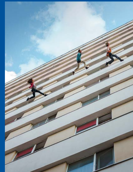
LIEU d'ÊTRE © Иван Манчевски LIEU d'ÊTRE © Ivan Mandevski